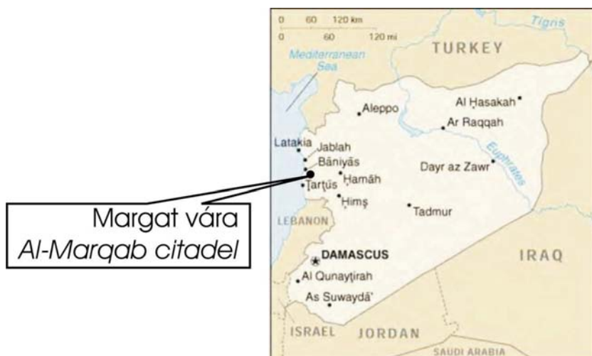
1. ábra. Margat vára a szír tengerparton. Fig. 1. Al-Marqab Citadel on the Syrian coast.

A régióban a holt-tengeri transzform vetőtől távolabbi területek földrengés-vizsgálata érhetően kevésbé intenzív. Ennek ellenére a régió – bővelkedvén stabil építésű ókori és középkori katonai és egyházi épületekben – kiváló lehetőségeket biztosít az archeoszeizmológiai vizsgálatokhoz.