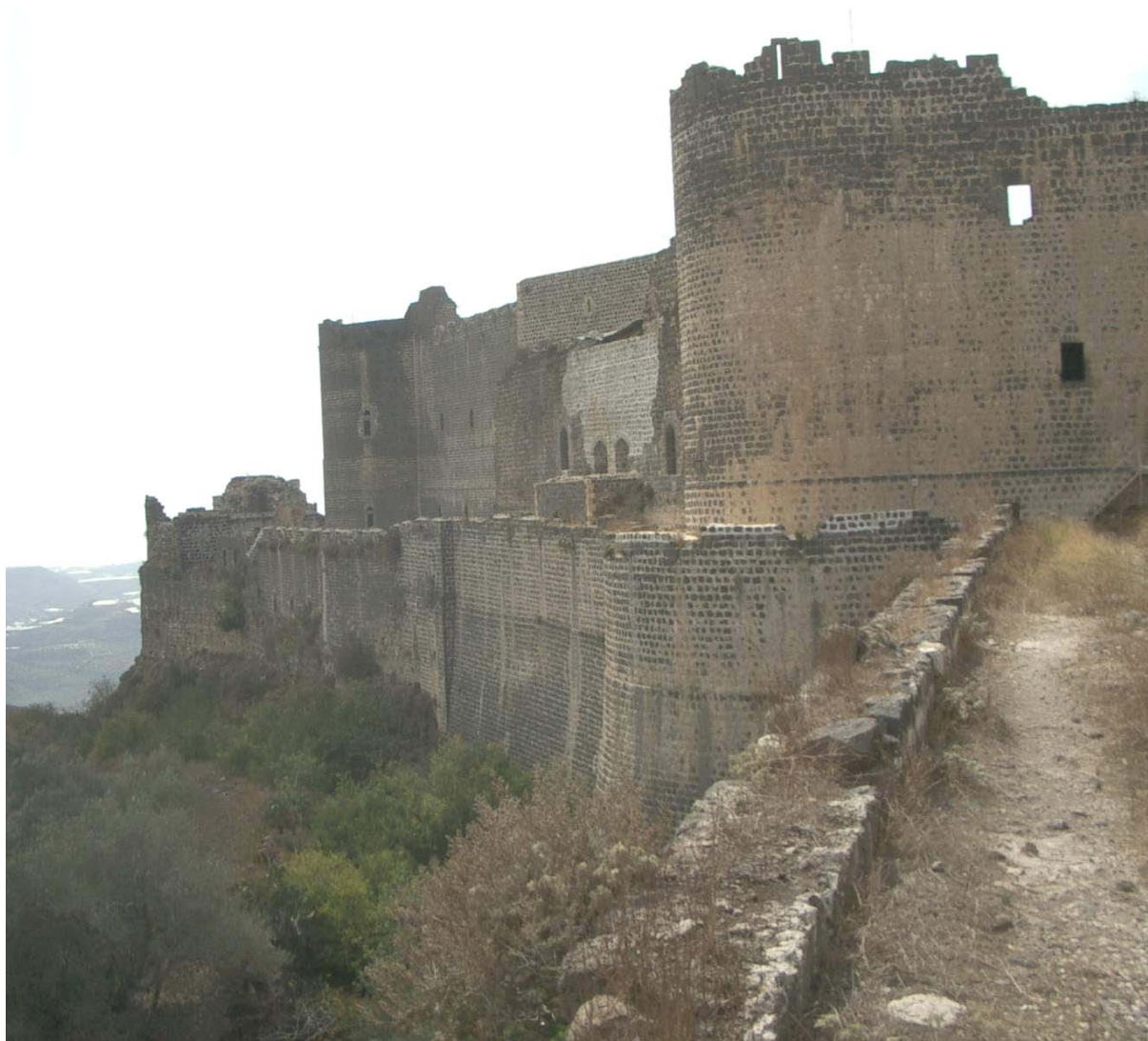
2. ábra. Margat vára. A citadella keleti falrendszere. Fig. 2. Al-Marqab citadel. Walls to the east.